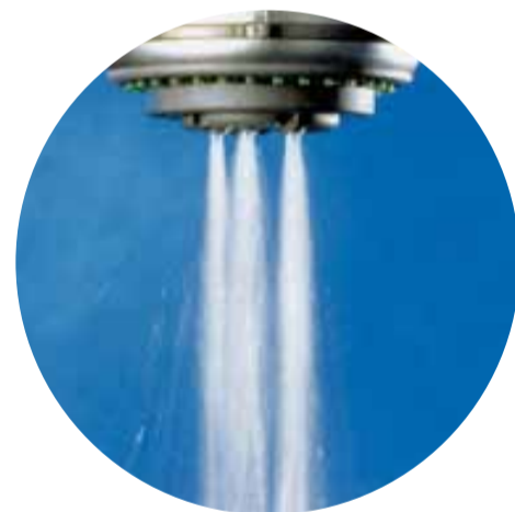
Le jet massant : pulsant, tonique.