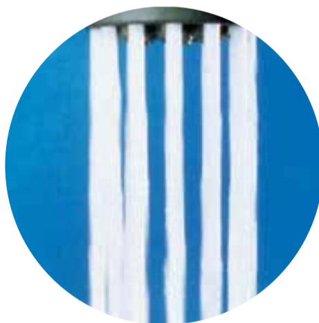
Le jet moussant : aéré, car l'eau est enrichie en air.