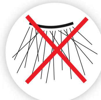
Avec douchette traditionnelle