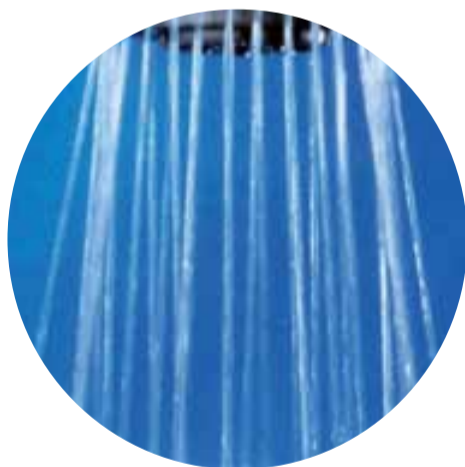
Le jet pluie : c'est ainsi qu'on appelle le jet normal.